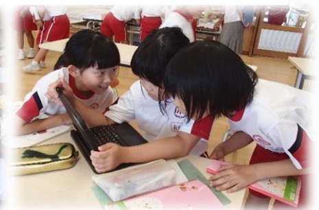
3年 国語科「こまを楽しむ」 学び合い学習