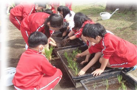
5年 総合的な学習の時間「わたしたちの米づくり」 苗植え