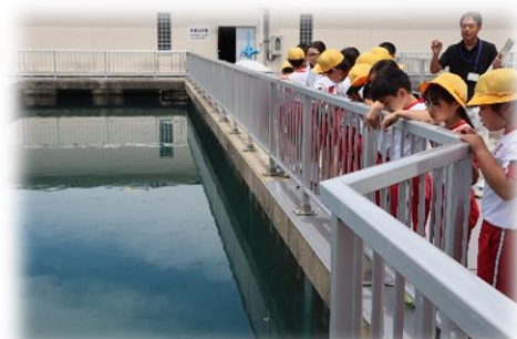
4年 社会科「水はどこから」 松島浄水場の見学