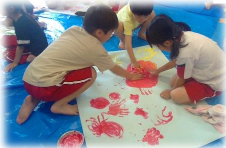
1年 図画工作科「さわってまげてきもちいい」 絵の具遊び