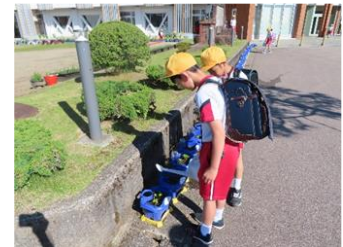
<水やりをする子供の様子>