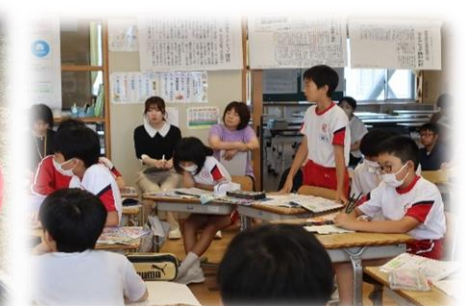
6年 社会科「南砺市民の願いを実現-利賀地域のライドシェア-」 聴き合い学習