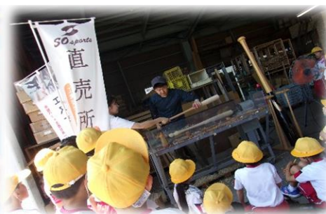
2年 生活科「ときどきわくわく まちたんけん」 バット工場の見学