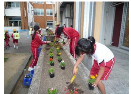
<花の苗を植え替える子供の様子>

委員会活動の時間には、5年生と6年生が協力して、毎年恒例となっている全校児童の短冊を玄関ホールに掲示する「七夕飾り」の製作に取り組んでいます。また、学校の周囲にある花壇に何種類もの色とりどりの花苗ポットを植えました。白い校舎に鮮やかな花々が美しく映え、登下校時や休み時間の癒しのひとときとなっています。委員会活動を通して、子供たちが温かく明るい気持ちを表現できるよう、支援していきたいと思ひます。