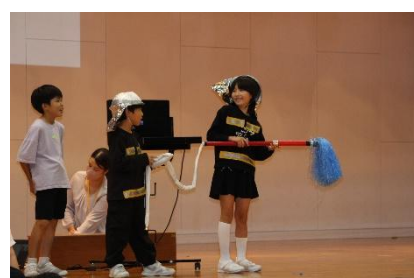
3年生 「福光大火とたたかったヒーロー ～火事からくらしをまもれ!～」