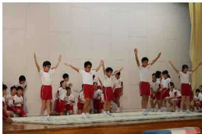
5年生 「つながる力」のびていく5年生