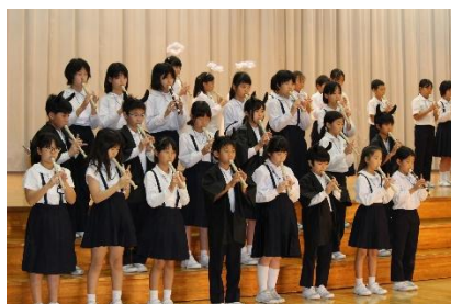
4年生 「みんなの心をあわせて レッツ!エンジョイ ミュージック♪」