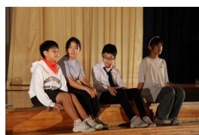
6年生 「何より大切なもの」