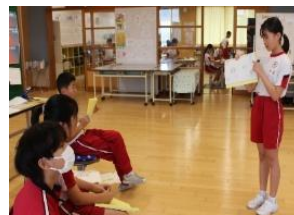
【グループ発表の様子】

また、互いに発表を聞き合うことを通して、コミュニケーションの仕方の基礎を学ぶとともに、クラスの仲間とよりよい人間関係を築いていくこともねらいとしています。今後もこのような活動を積み重ね、コミュニケーション力と人間関係の向上を図っていく予定です。