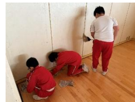
【西部体育館の隅を清掃する子供】