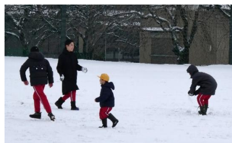
【雪遊びを楽しむ子供たちの様子】

今日も、子供たちは冬を楽しみながら活動しています。地域の皆様、保護者の皆様、これからも中部っ子たちの応援団としてご支援ご協力をよろしくお願いいたします。