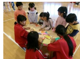
【折り紙の折り方を教える子供】

このような福祉活動を通して、子供たちは相手を笑顔にしたり地域の役に立ったりすることの喜びを感じることができました。これからも、相手思いやって行動する子供たちの成長を認め励ましていきたいと思っています。