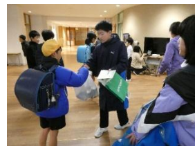
【アルミ缶回収の様子】

こうした福祉の輪が広がり、中部っ子の温かい心の成長につながってほしいと思います。