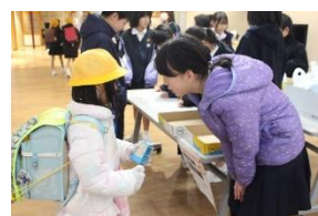
【赤い羽根共同募金活動の様子】